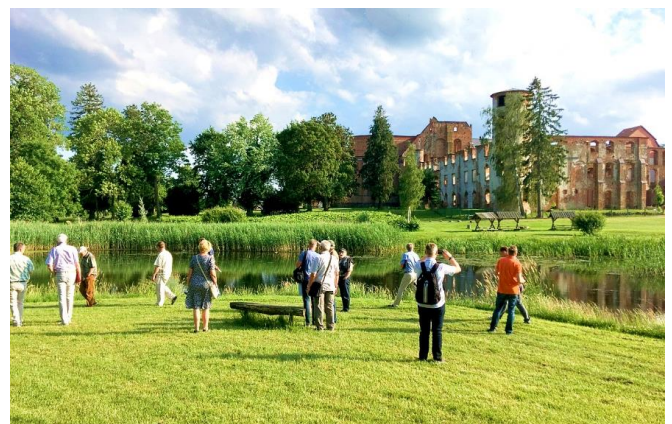
Exkursion über das Klostergelände in Dargun.